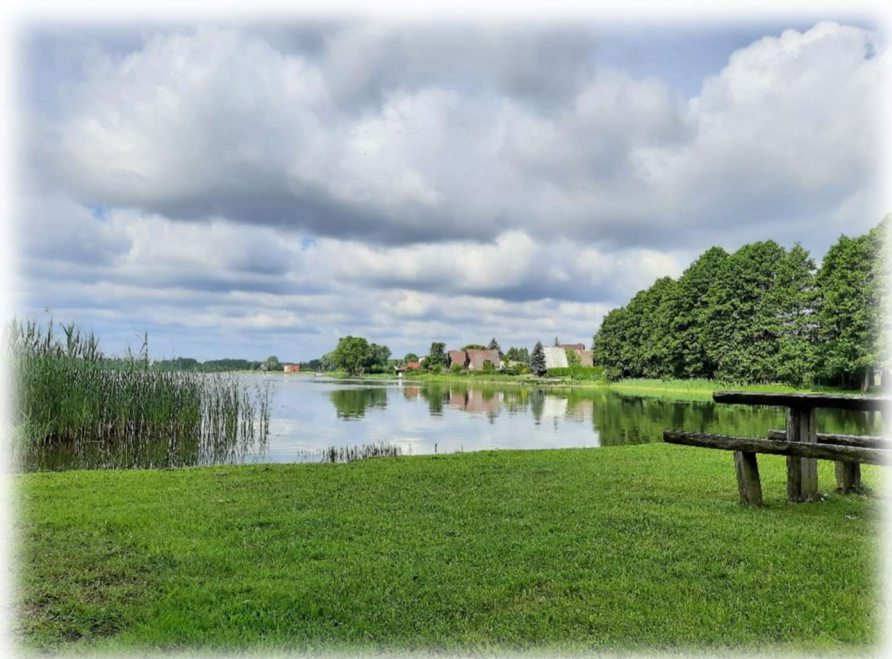
Jezioro Kałëbie, Osiek