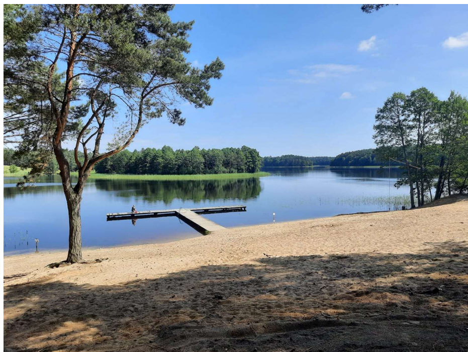
Jezioro Czarne – plaża przy ul. Wczasowej w Osieku