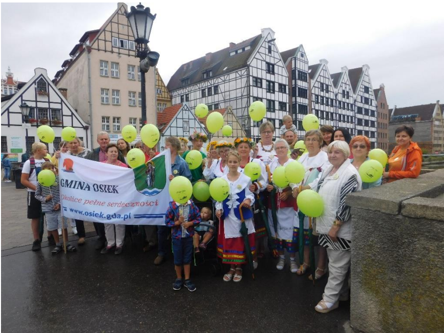
Reprezentacja Gminy Osiek podczas Korowodu Kociewskiego